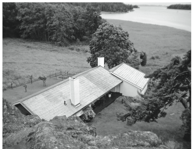
Ein Haus, eingepasst in die Natur

«Uns fasziniert die Einpassung des Hauses in die Natur, die Erdverbundenheit durch die eingeschossige Konstruktion, die sanfte Abtrepung zum Ufer hin. Überhaupt hat Asplund urtümliche Themen wie das schützende Dach über dem Kopf oder das wärmende Feuer virtuos in der Wohnlandschaft umgesetzt, so wird beispielsweise das massive Cheminée zum Dreh- und Angelpunkt in der Wohnlandschaft. Der gesamtheitliche Anspruch ist in jeder Nische, jeder Oberfläche und jedem Möbel spürbar, die Räume sind auf die Bewohner massgeschneidert.» Thom Huber, Claudio Waser und Claudia Mühlebach; huber waser mühlebach, Luzern. Letzter gewonnener Wettbewerb: REAL Recycling Center, Ebikon (2017).